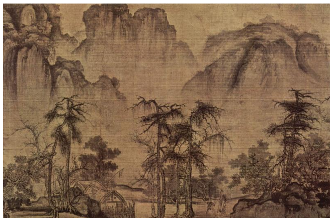
Го Си Осень в речной долине