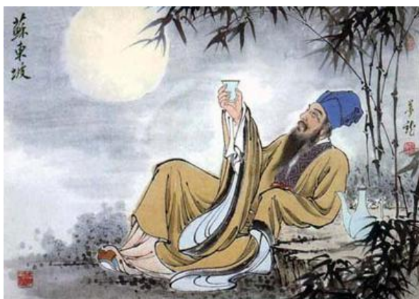
Портрет Су Ши

Су Ши - поэт, художник, каллиграф эпохи Северной Сун. Его второе имя – Цзючжань или Хэчжун, псевдоним – Дунпо Цзюйши («отшельник Дунпо»). Для своих потомков он всегда оставался образцом для подражания. В Су Ши видели и крупного чиновника, принципиального и бесстрашного в борьбе с врагами, и беззаботного эпикурейца, наслаждавшегося малыми деревенскими радостями, и крупнейшего поэта, признанного лидера лучших талантов своего времени, и прозорливого художественного критика, открывшего новые горизонты в практике изобразительного искусства. Жизненный путь Су Ши, знавшего и блистательное раннее начало карьеры, и происки врагов, и неоднократные ссылки, и годы прозябания в глуши, был для ученого сословия Китая образцом высокой нравственности и утешением в собственных невзгодах.