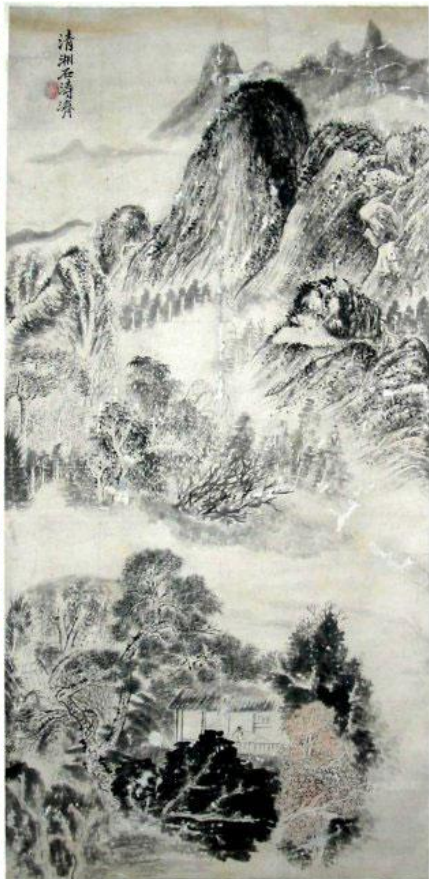
Ван Вэй Осенние мысли