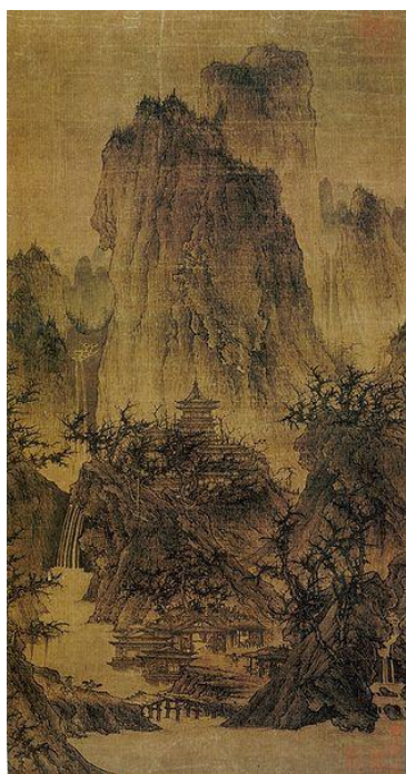
Ли Чэн Буддийский храм в горах