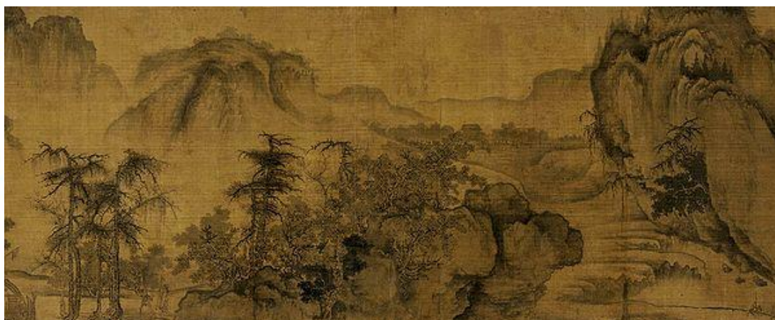
Го Си Осень в долине реки. Фрагмент свитка

Э поха Сун - период нового подъёма китайской культуры, сохранившей и приумножившей многие замечательные достижения танского времени. Это была последняя великая эпоха в истории классической средневековой поэзии, достойно завершившая период её расцвета. Это было время значительных успехов повествовательной прозы на разговорном языке, дальнейшее обогащение изобразительных средств и содержания поэзии, развитие нового стихотворного жанра - цы , главной темой которого стала любовная лирика. Выдающиеся мастера этого времени: Янь Шу (991-1055), Янь Цзи-дао (1030-1106, сын Янь Шу), Фань Чжун-янь (989-1055), Ли Юн (987-1053), Оуян Сю (1007-1072), Ван Лин (1032-1059), Су Ши (Су Дун-по, 1036-1101), Ли Цин-чжао (1084-1151), Синь Ци-ци (1140-1207), Вэнь Тянь-сян (1236-1282), Гао Ци (1336-1374).