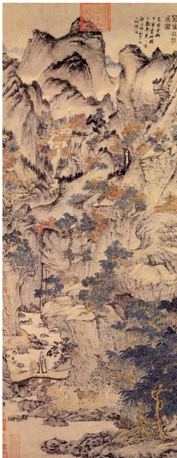
Фань Гуань Путники среди Гор и Потоков

К закату поднимаюсь на пик Жаровни, Взгляну на юг — там водопад вдали, Обрушиваясь с высоты огромной, Он расплескался на десятки ли. Летит стремительно, как огонь небесный, Слепит искрением радужных цветов, Ты словно встал перед Рекою звёздной, Что низвергается из облаков. Окинешь взглядом — сколько в этом мощи! Природные творенья — велики! Сих струй и ураган прервать не сможет, В ночи бледнеет месяц у реки. Из тьмы небесной эти струи пали, Окатывая стены горных круч, На камнях капли - перлы засверкали, Как зоревой передрабассветный луч. Люблю бродить по этим чудным скалам, Они душе несут покоя дар, Мирскую пыль стряхну с себя устало - И словно выпью Яшмовый нектар. Мне любо благолепие такое, Где расстаюсь я с суетой мирскою.