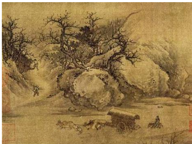
Фань Куань Путешественники среди Гор и Ручьёв

Меня весной не утро пробудило: Я отовсюду слышу крики птиц. Ночь напролёт шумели дождь и ветер. Цветов опавших сколько – посмотри!