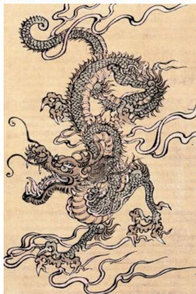
Китайский дракон, национальный символ. Гравюра, выполненная в стиле китайской школы. XIX в.

Поэзия – это эхо в ущелье, луна в воде, образ в зеркале, отблеск на поверхности... слова исчерпывают себя, но смысл не исчерпаем