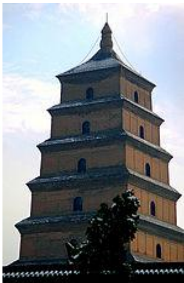
Большая пагода Диких гусей г. Сиань (Чаньань)

(Два поэта, после совместного посещения Даяньта – «Большой пагоды диких гусей» написали это стихотворение)